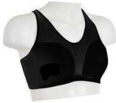
Protector de pecho tipo "TOP"