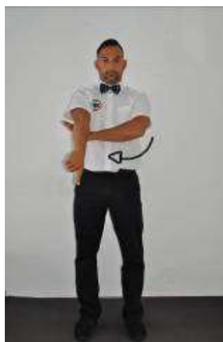
2/3/4 aviso oficial: conllevan resta de puntos