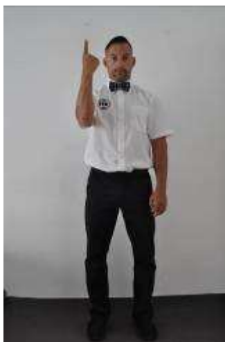
Primer aviso oficial: no conlleva resta de puntos.