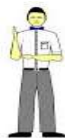
1-2-3 resta de punto

Anunciará a los tres jueces la amonestación de un punto.