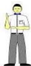
1-2-3 resta de punto

Anunciará a los tres jueces la amonestación de un punto.