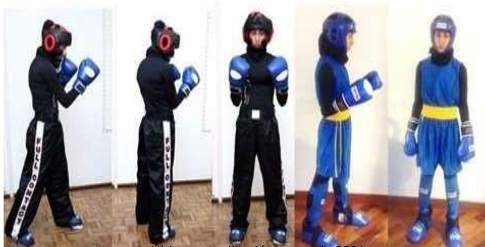
Ultima actualización enero de 2021

En todo caso deberán llevar cubierto todo el cuerpo, no se permite que sea parcial.