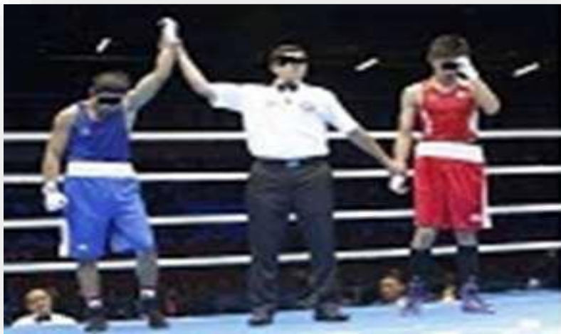
Uniforme arbitral para amateur.

Todos los oficiales, (árbitro central, los jueces, cronometrador y contador de patadas) vestirán pantalón negro, camisa blanca FEKM, deportivas negras, cinturón negro y pajarita.