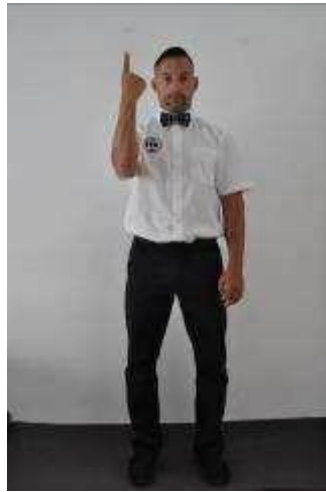
Primer aviso oficial: no conlleva resta de puntos.